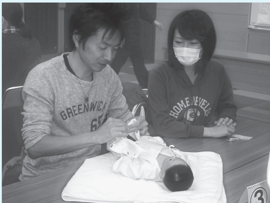
マタニティクラスの様子