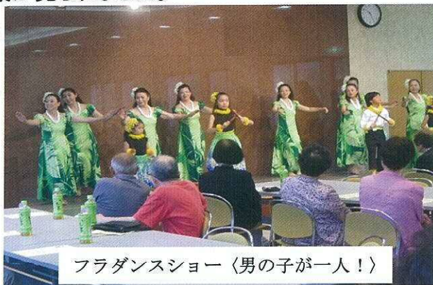
フラダンスショー〈男の子が一人！〉

午前10時から始まるアトラクションのフラダンスショーでは、軽快な音楽としなやかな手足の動きに皆さんも引き込まれ、右に左に体を揺らす光景が見られました。