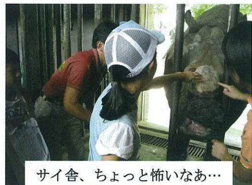
サイ舎、ちょっと怖いなあ…

極め付きは、サイ舎に入っての直接の餌やり体験。「顔なでてやって」と言われ、こわごわ乍らやり終わると笑顔の子供たち。子供はもちろん、大人も大興奮の体験が出来た一日でした。