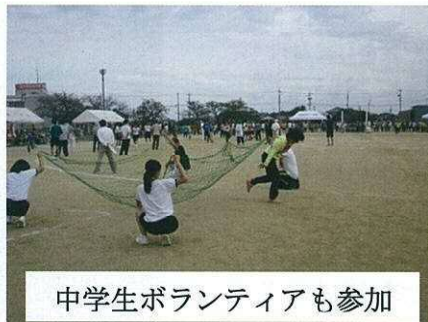
中学生ボランティアも参加