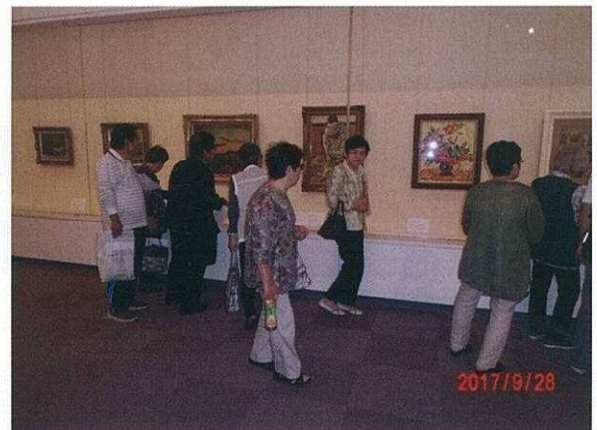
皆さん、真剣な眼差しで鑑賞されていました

忙しい私たちの毎日、時には足を止め、作品に触れることも良いのではないのでしょうか。