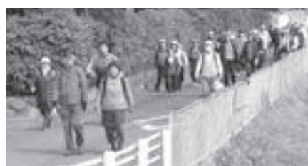
緑道や日光川沿いの5kmを楽しくウォーキングしました。