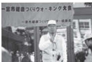
修文大学で集合しました。