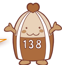
一宮市マスコットキャラクター いちみん

その他にもたくさんの事業を行い、 新計画を推進していきます。 新計画の推進には、市はもちろんのことですが、個人や家庭、 町内会などの地域、民間の企業や団体、学校などが、 それぞれの役割や責任を果たしながら、 相互に協力していくことが大切です。 ご協力よろしくお祈いします。