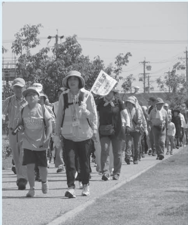
健康づくりサポーター活動の様子