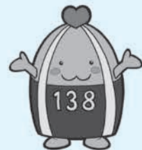
一宮市マスコットキャラクター「いちみん」