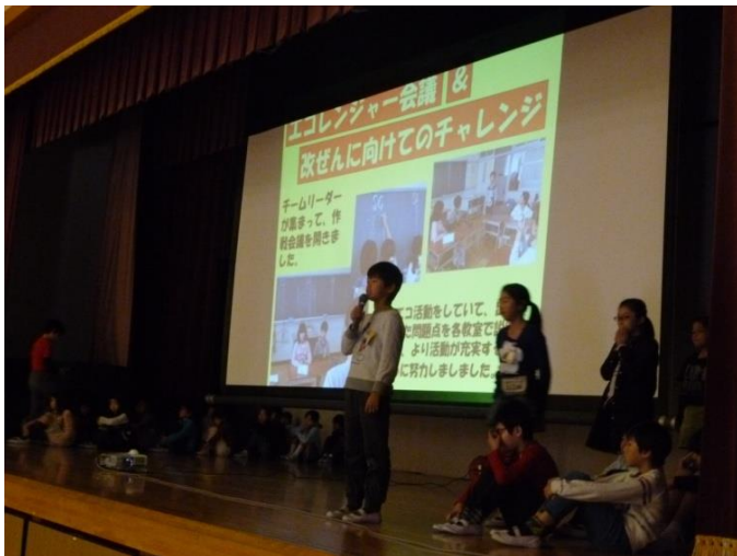
▲エコレンジャーの活動を全校集会で呼びかけ