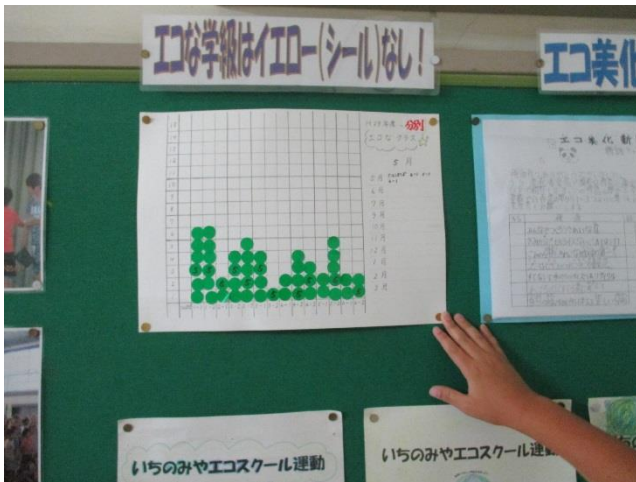
▲分別イエローカード集計表