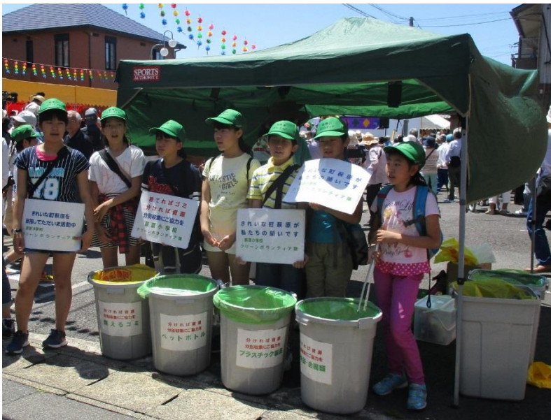
▲チンドン祭りでのクリーンボランティアの様子