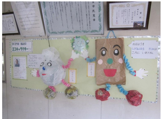
▲エコキャラクター