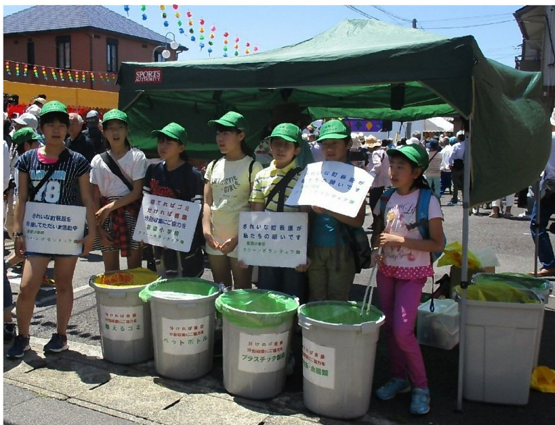
▲チンドン祭りでのクリーンボランティアの様子