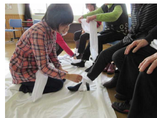
足首のねんざの固定にも！