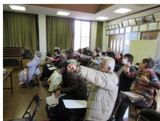
予防体操もがんばりました！