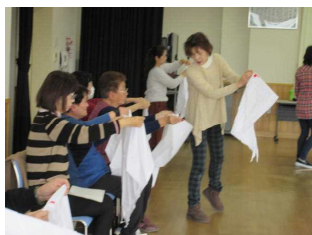
まず折り方を学びます