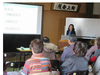
一宮市が超高齢社会！