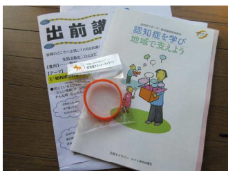
サポーターの証オレンジリング

大日公民館で大日・下渡り合同で、一宮市地域包括支援センターの出前講座「認知症サポーター養成講座」を開催しました。参加者は老人クラブ、町内の福祉協力員だけでなく介護に興味のある方々などさまざま、現在の認知症の実態やその症状・種類などについて真剣な表情で講義を聞きました。認知症の人の気持ちをまず第一に考えて対応することの大切さやサポーターとして何をすれば？などを知ることができました。認知症だけでなく病気の人や障害のある人など、困っているその人の立場に立って気持ちを考えてサポートしていくことは共通した課題になりますね。