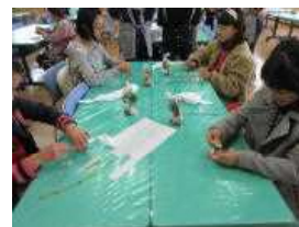
紅白のお餅を丸めて 花餅かざりづくり！