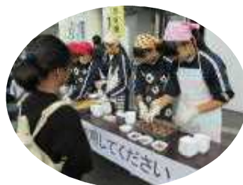
何回でもお代わりしてね～