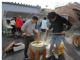
みんなのために がんばるぞ～