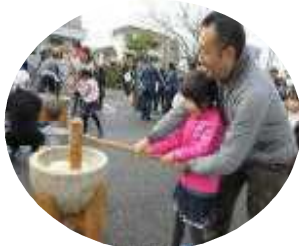
よいしょ～ぺったんこ！