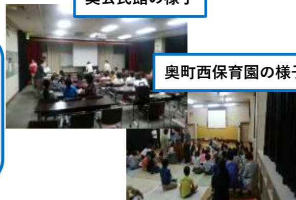
奥町西保育園の様子