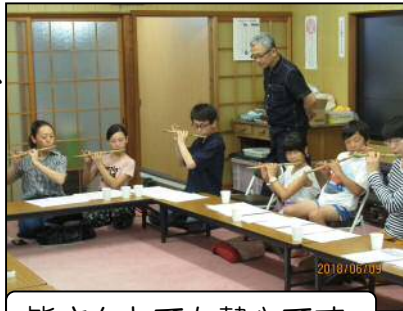
皆さんとても熱心です

て開催される第1回朝日盆踊りには、稽古の成果が発表できる場が予定されており、それに向けて猛練習中とのことです。