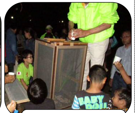
ここでよく見られるよ