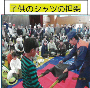
子供のシャツの担架