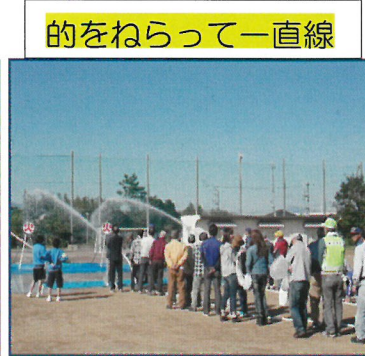
的をねらって一直線