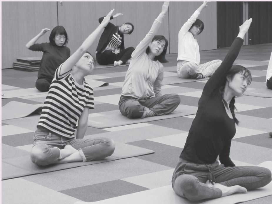
「女子力アップ教室」の様子