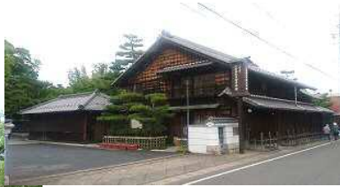
旧林家庭園は、石の美しさと石組みの技術に圧倒されます。