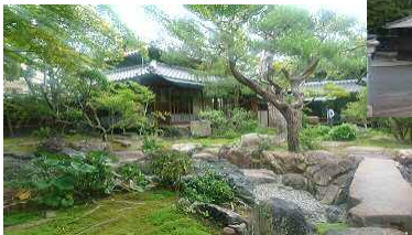
脇本陣林家の庭園