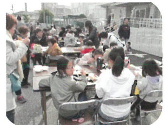
おいしいね! つきたての餅と豚汁