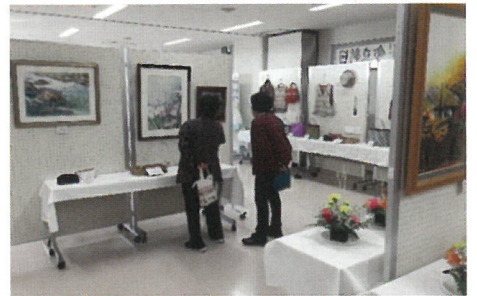
プロ顔負けの力作に感動しきり!

11月17・18日(土・日)、大徳公民館にて「作品展」が開催されました。公民館活動グループや大徳地区サークル活動の皆さんによる日頃の成果が作品として発表、展示されました。絵画、書、華道、工芸、写真の5部門の力作や小学生の工作など多数の秀作に、鑑賞に訪れた人の感動の声や称賛のつぶやきが聞こえ、深まる秋の芸術を満喫しました。(阿南)