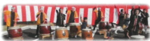
威勢のいい太鼓に合わせて ぺっタン、ぺっタン!

好天に恵まれた 12 月2日(日)、公民館の魅力ある地域づくり部主催「ふれあい餅つき大会」が大徳公民館駐車場で催されました。午前10時からぺったん、ぺったんと餅つきが始まり、熱気でムンムン。時には、よるけながら杵を打つ子に、優しく手を添える親さんのほほえましい光景も見られました。また、「新開いぶき会」による威勢のいい和太鼓が餅つきに拍車をかけていました。会場は約 500 名の来場者で賑わい、つきたてのあんこ餅やきなこ餅と豚汁がふるまわれ、子ども達もお菓子釣りゲームや珍しい花もちづくりを楽しみました。(野田)