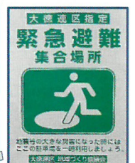
集合場所の看板 (31年設置予定)