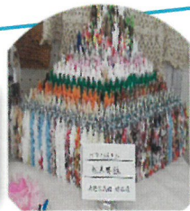
折鶴バタフライタワー