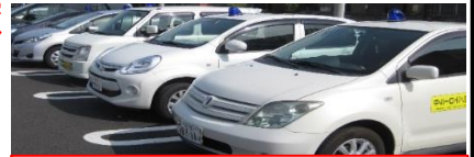
青色回転灯を装備した自動車