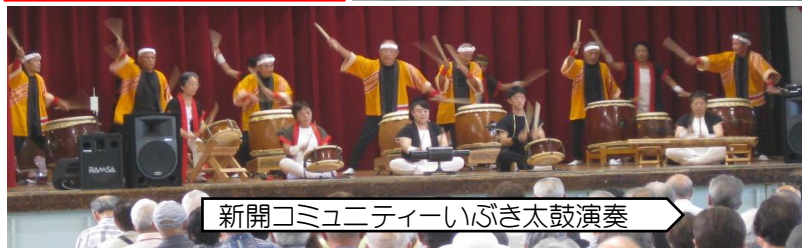
新開コミュニティーいぶき太鼓演奏