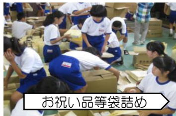
お祝い品等袋詰め