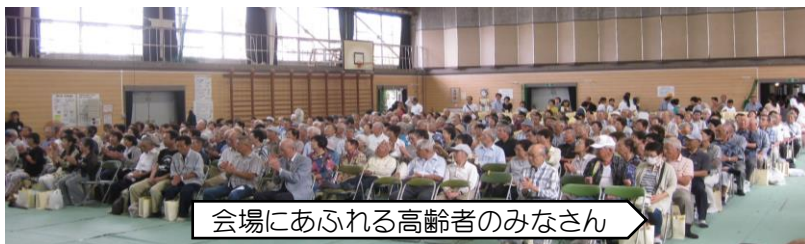
会場にあふれる高齢者のみなさん

社会の発展に貢献された 高齢者に敬愛・感謝のいっ そうの高揚と長寿の祝意 を表す場とする。