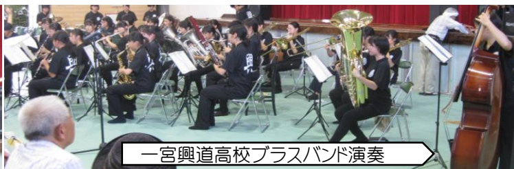
一宮興道高校ブラスバンド演奏