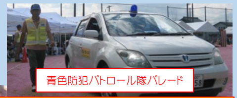
青色防犯パトロール隊パレード