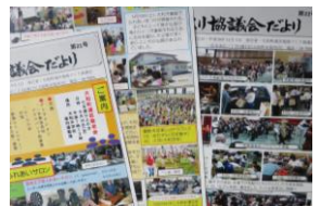
地域づくり協議会だより