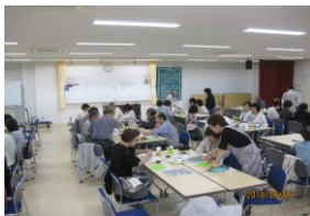
ニコニコ・サロン

新年明けましておめでとうございます。 連区の皆様には未来に向けて大きな希望に満々た輝かしい新春をお迎えのことと心よりお慶び申し上げます。我「地域づくり協議会」も5度目の新春を迎えるところとなりました。 4つの部会(安全安心・活気健全・おもいやり・広報)も事業の充実を目指し頑張っています。 「安全安心部会」は、みなさんの安全のため、夜間の青色パトロールや小学校の登下校時に見守り活動を増やし巡回に努力してまいります。