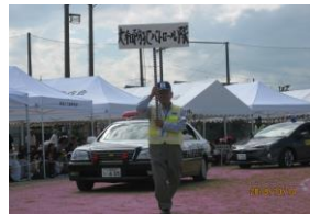
青色防犯パトロール隊

「おもいやり部会」は、連区在住の憩いの場「ニコニコ・サロン」を開催し、参加者の皆さんが楽しかったと思っただけの場になるように努力してまいります。併せて各町内で行っている「ふれあいサロン」と協働して、高齢者・要支援者の方々を一人でも多く救済支援できるよう努力してまいります。