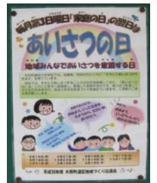
第3月曜日・あいさつの日