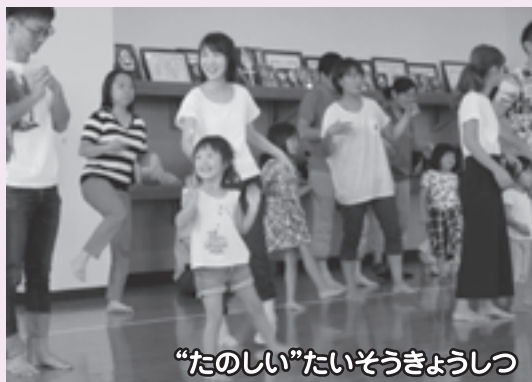
“たのしい”たいそうきょうしつ