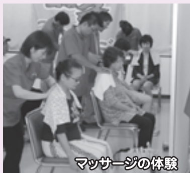
マッサージの体験