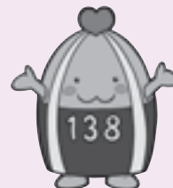
一宮市マスコットキャラクター「いちみん」