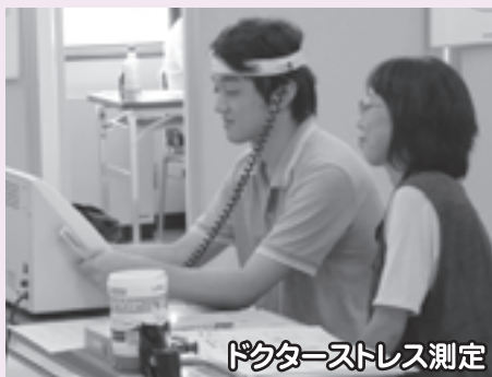
ドクターストレス測定