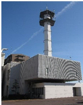
KDDI(株)名古屋 ネットワークセンター