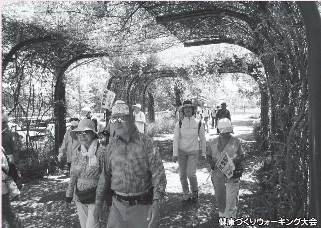
健康づくりウォーキング大会