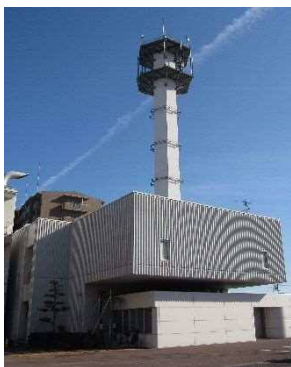
KDDI(株)名古屋 ネットワークセンター