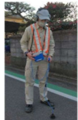
漏水探知器にて路面下の漏水音を確認