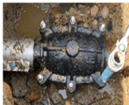
漏水が発見されたら速やかに修繕を行います。