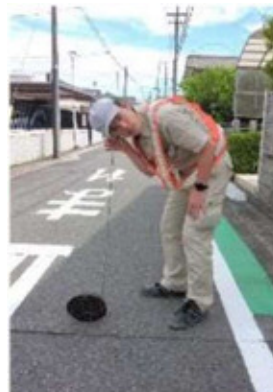
音聴棒にて仕切弁の漏水音を確認