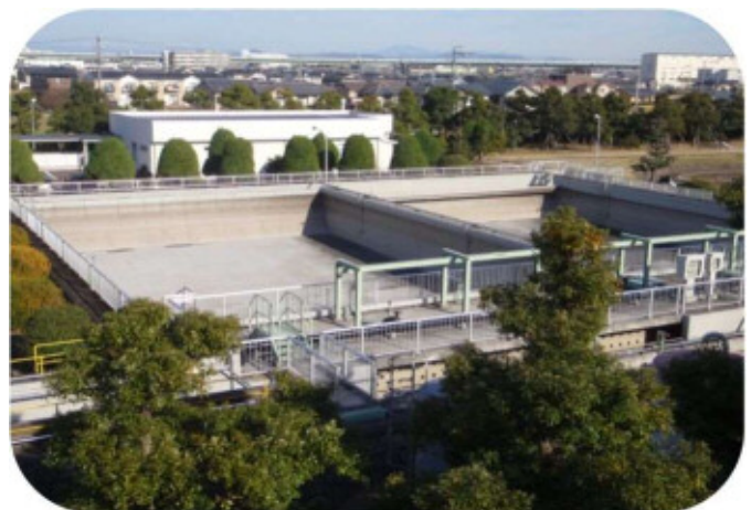
合流式下水道改善施設（東部浄化センター内）

雨水と汚水を一緒に処理する合流式下水道では、雨天時に大量の雨水が流れ込むと、一部が汚水と混ざって河川に放流されることがあります。特に降り始めの雨水には汚れを多く含むため、未処理で放流すると河川が汚れる原因となります。これを防ぐために、雨天時に合流式下水道改善施設に下水を一時的に貯留し、沈でんや消毒処理を行うことで未処理下水の放流を減らしています。