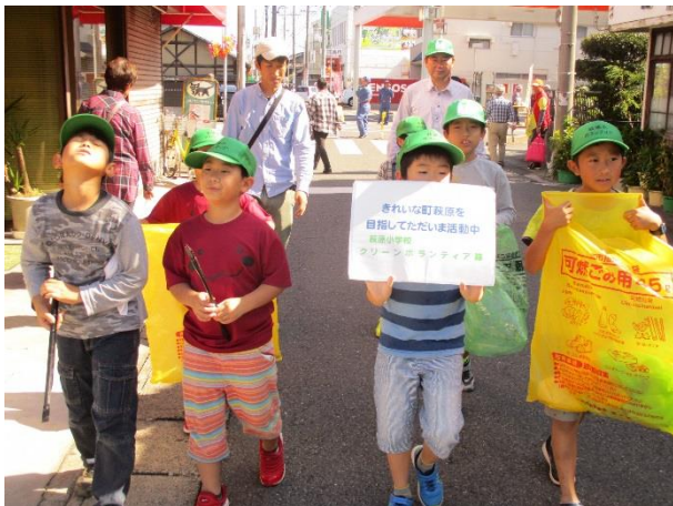
▲ボランティア活動