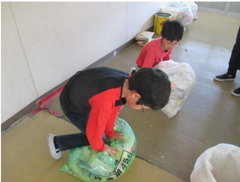
▲ごみの回収・計量