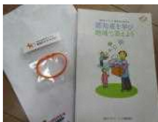
サポーターの証オレンジリング

『腸は第二の脳』、『ふくらはぎは第二の心臓』だそうで講義の最後に体と頭を使う認知症予防の体操も教えていただきました。認知症だけでなく病気の人や障害のある人など困っているその人の立場に立って気持ちを考えてサポートしていくことも大切だと感じる内容でした。