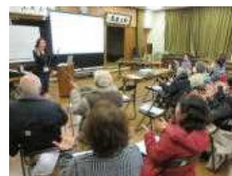
予防体操もがんばりました！