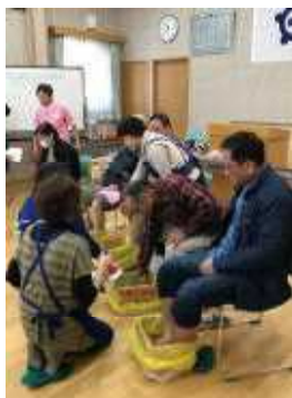
足湯でリラックス