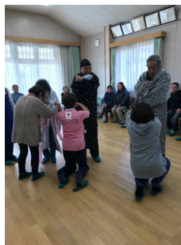
毛布であったかガウン

中島町内会が災害時高齢者生活支援講習会を中島公民館で開催しました。一宮市赤十字奉仕団北方分団の岩月さんらが講師となって、ビニール袋でご飯を炊く方法、たった100ccのお湯で体じゅうを拭くおしぼりを作る方法、ダンボール箱とゴミ袋で簡単に足湯をする方法、毛布1枚とひも1本であったかガウンを作る方法、心身リラックスのためのハンドマッサージの練習などの講習を受けました。盛りだくさんな内容で予定していた2時間があっという間に感じるほど充実したものでした。