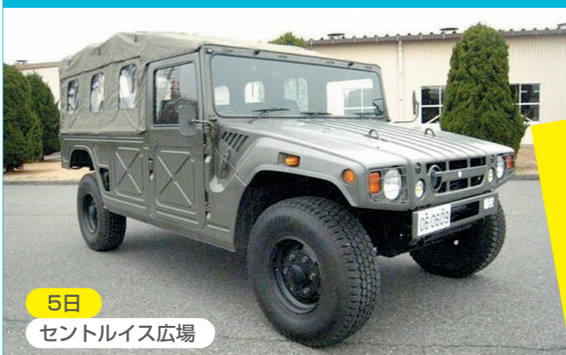
5日 セントルイス広場

主催：国営木曾三川公園 三派川地区センターイベント実行委員会 後援：木曾川上流域公園整備促進期成同盟会