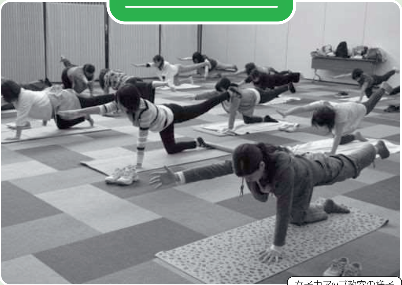
女子力アップ教室の様子