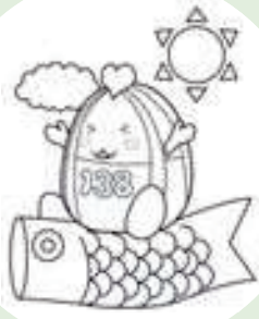
一宮市マスコットキャラクター 「いちみん」