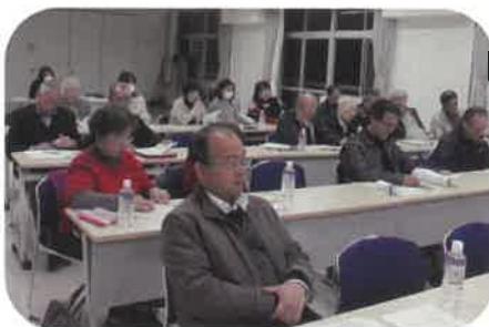
熱心に審議・検討する会員