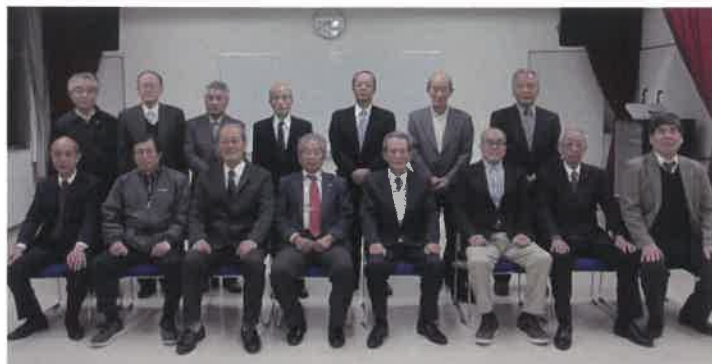
大徳連区地域づくり協議会役員 (敬称略)

去る3月22日、大徳公民館大会議室で大徳連区地域づくり協議会の総会が行われました。はじめに、平成30年度事業報告及び会計報告が承認されました。続いて、新年度の事業計画案及び予算案が提案され、十分な審議の後、原案通り満場一致で可決、決定されました。今後、地域づくり協議会各部会・諸団体で執行される予定です。新年度の役員ならびに予算・事業計画について、次に掲載いたします。(野田)