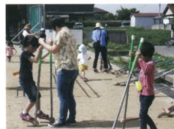
お母さん!ちゃんと持ってて!