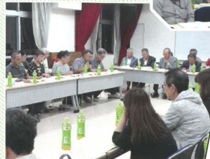
真剣に審議する公民館役員・委員