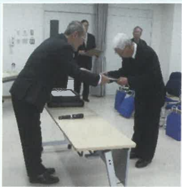
長年の善行で表彰

4月24日(水)大徳公民館で社会福祉協議会大徳支会総会が行われました。はじめに、善行者表彰が行われ、一般の部で、登下校時の見守り活動及び保護司や地域活動に長年貢献した4名、児童・生徒の部で、他の児童・生徒の模範であることで6名の小・中学生が表彰されました。続いて平成30年度事業報告及び収支決算報告の承認、新年度事業計画案及び予算案が満場一致で可決されました。(野田)