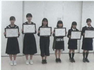
模範生徒で表彰された小・中学生