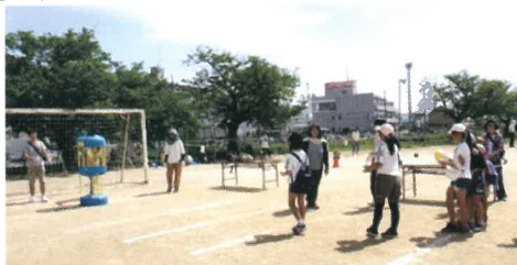
的をよーく見て エイツ!

5月12日(日)、大徳小学校運動場で子ども会のゲーム大会が行われました。当日は晴れ間がのぞく天気で気温も高く、小学生や幼児など377人が広い運動場で思いっきりゲームを楽しみました。マジックボールビンゴ、PK シュート、フラフープ、竹馬など7か所のゲーム場で歓声を上げながら、パーフェクト賞を狙って、みんな夢中で遊びました。(野田)