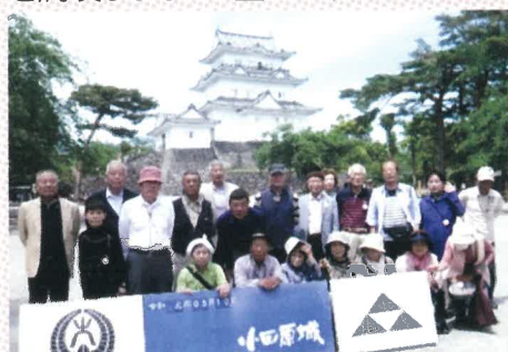
小田原城をバックに記念撮影

の小田原城址を散策。帰りには蒲鉾・干物の買い物ツアーを楽しみ、手提げ袋いっぱいにして帰ってきました。(村瀬)