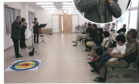
シルバースのオカリナ演奏に聴き入る参加者