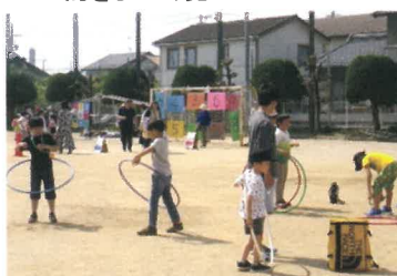
フラフープってむずかしいね