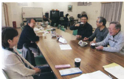
コーヒーを飲みながらのよもやま話