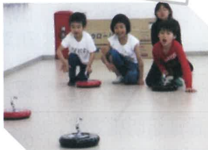
カーリングで遊ぶ子供たち