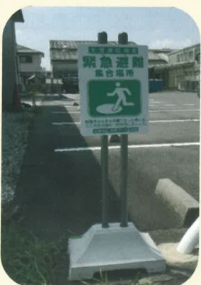
駐車場に建てた避難看板

大徳連区地域づくり協議会では昨年度、災害発生時にいち早く身の安全を確保できるような情報をマップにまとめて大徳地区全戸に配布しました。今回さらに緊急避難集合場所が地域住民にわかりやすいよう、案内の看板を作成しました。それを4地区それぞれの3、4か所にフェンスや壁に掛けるか、立看板として設置しました。地域住民の皆さんは一度、自宅近くの看板のある緊急避難集合場所の確認をしてください。(野田)