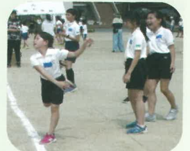
どう?みごとなフォーム

晴天に恵まれた6月23日(日)大徳連区子供会主催のドッジボール大会が大徳小学校で行われました。8時30分に開会式が行われた後、4地区の児童160名が4コートに分かれて、白熱した試合を繰り広げました。今年は昨年度までのトーナメント方式をやめ、男女別チームを編成してゲームを楽しみました。保護者の熱のこもった声援がいっそう試合を盛り上げ、各地区子ども会のチームワークが存分に発揮できた大会でした。(阿南)