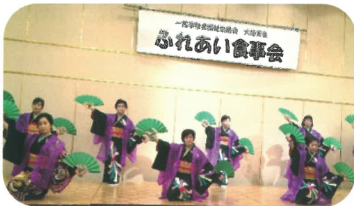
あすか会のあでやかな踊り

ひとりぐらし老人ふれあい食事会が、社会福祉協議会大徳支会主催で、6月9日(日)尾西グリーンプラザで行われ、約70名の参加者が久しぶりの再会とおしゃべりを満喫しました。開会式後のアトラクションでは、「琴稀会」の大正琴が演奏され、懐かしい「ひばりの花売り娘」や「高校三年生」を口ずさみ、「ふるさと」を郷愁込めて合唱しました。