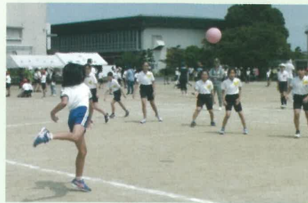
「投げた」「捕った」どちらも必死

保護者の熱のこもった声援がいっそう試合を盛り上げ、各地区子ども会のチームワークが存分に発揮できた大会でした。(阿南)