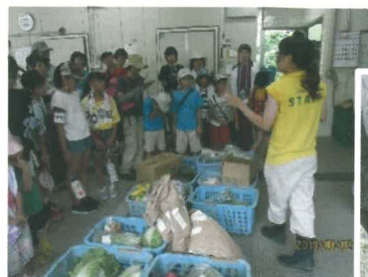
動物たちのおやつは何か? リンゴ? みかん?

うだるような暑さの中、8月2日(金)公民館社会見学で東山動物園に行きました。小学生以下の子ども16名を含めた35名の参加者は、課題の動物クイズを調べようと熱心に園内で観察していました。東山スカイタワーレストランでのランチバイキングの昼食後は自由散策。午後2時から環境教育プログラム「動物のレストラン」で飼育員さんの説明を聞きながら、動物たちの食餌を見学しました。最後に一人一人、インドサイにリンゴや人参をあげました。みんなおっかなびっくりでしたが、大変良い体験をしました。(野田)