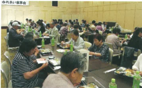
おしゃべりもはずむ食事会

また、「あすか会」の新舞踊が披露され、その艶やかさにうっとりとする光景も見られました。その後、食事会では一堂に会して食べる楽しさに、「いつもは食べ残すのに今日は…」などと笑いながら癒しのひと時を過ごしました。(阿南)