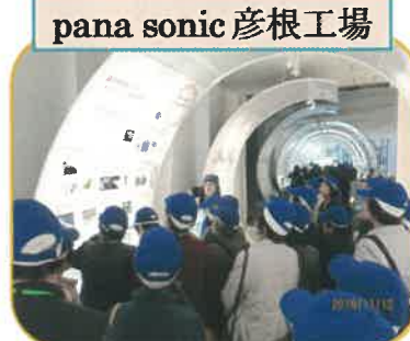
pana sonic 彦根工場