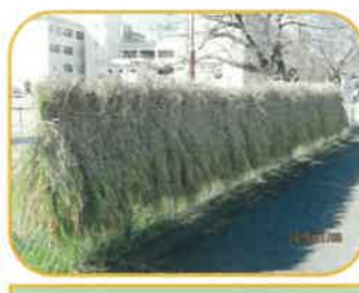
昔はハサカケでした