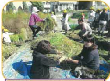
お母さんもお手伝い