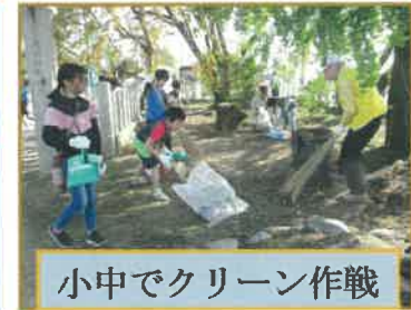
小中でクリーン作戦

○11/6 教養講座7 社会見学 福井・養浩館庭園、北前船のカワモト福井物産館、越前めがねの里、前越そばの里を見学しました。