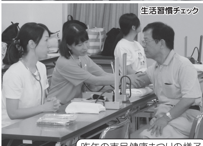
生活習慣チェック