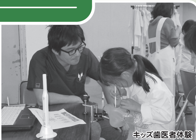
キッズ歯医者体験