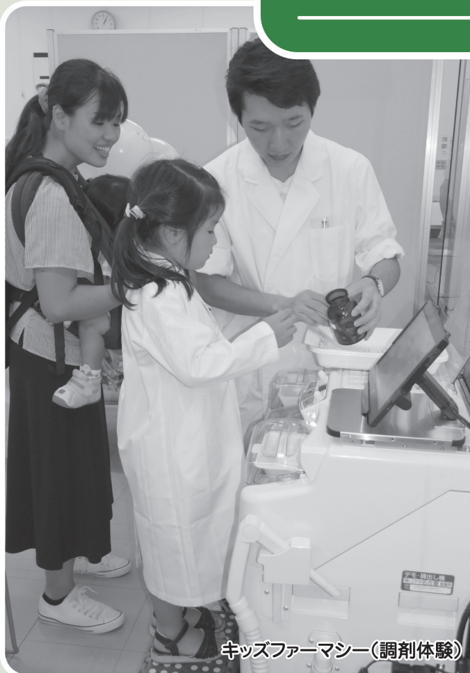
キッズファーマシー(調剤体験)