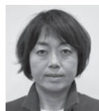
宇山 祥子 (立憲民主党-宮市議会)