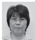
水谷 千恵子 (公明党)