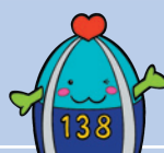
一宮市マスコットキャラクター いちみん

一宮市議会の情報については、一宮市のウェブサイト (ホームページ)からご覧いただけます。 ID 1000010