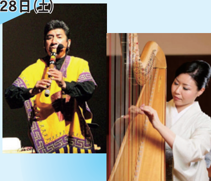
アンデス音楽×ハープ コラボライブ