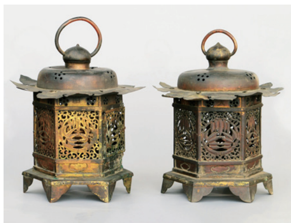
▲「金銅釣燈籠」室町時代(真清田神社蔵)

※月曜日(16日・23日を除く)、17日(火)・24日(火)は休館 大人500円、高・大学生250円、中学生以下無料(市外の小中学生は100円)