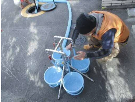
【応急給水栓使用状況】

応急給水栓は、浄水場・配水場からの給水ルートとなる水道管の耐震化が完了した指定避難所から順に設置しています。