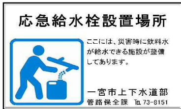
【応急給水栓表示看板】