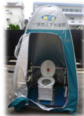
実際に設置したもの

内径60cmの鉄筋コンクリート管を敷設し、一定間隔で垂直にビニル管を立ち上げ、これにマンホール蓋（直径30cm）を設置してあります。マンホール蓋を開け、仮設テントと便器を組み立て、下水道管に一時貯留してから本管へ流します。