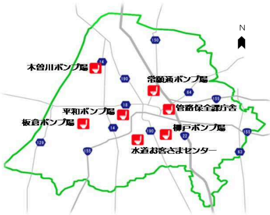
【災害用マンホールトイレ位置図】

上下水道部は、下水道施設内に災害用マンホールトイレを市内7箇所、計34基設置しています。