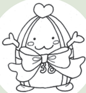
一宮市マスコットキャラクター 「いちみん」