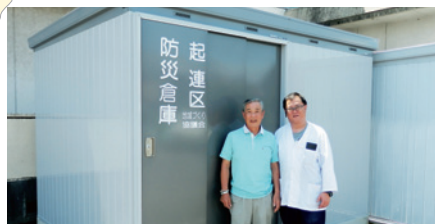
◀新たに設置した 防災倉庫

5月には「木曾川ウォーキング大会」を開催しました。従来は子ども会の主催で行っていましたが、今回は、幼児から高齢者までの三世代が参加できるウォーキング大会として計画し、学校外活動推進委員会の主催、公民館魅力部・体育レクリエーション部の協賛により開催しました。爽やかな風が吹き、ウグイスの鳴き声が聞こえる河川敷遊歩道のウォーキングには、総勢220人が参加し、事故もなく盛況のうちに終わることができました。