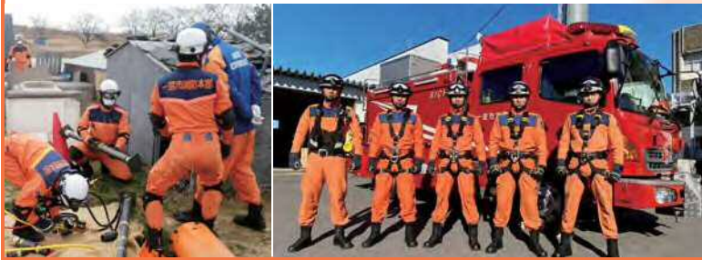
【問】中核市移行推進課 ☎(85)7003

地震災害などの大規模災害に備え、画像探索機・地中音響探知機などの高度救助資機材と、人命救助に関する専門的かつ高度な教育を受けた隊員から成る高度救助隊を編成します。救助体制を充実させ、市民の皆さんの安全・安心を守ります。