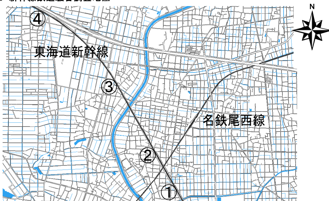
図5-2 新幹線鉄道騒音調査地点