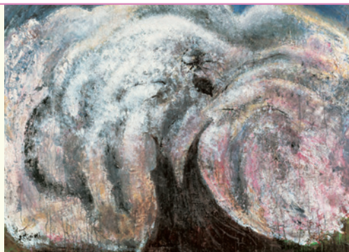
▲「さいたさいたさくらがさいた」1998年©MIGISHI