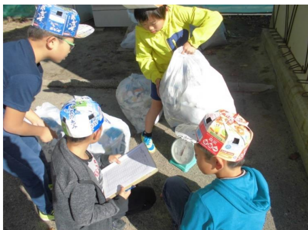
ごみ量計量(作成したエコキャップを着用)