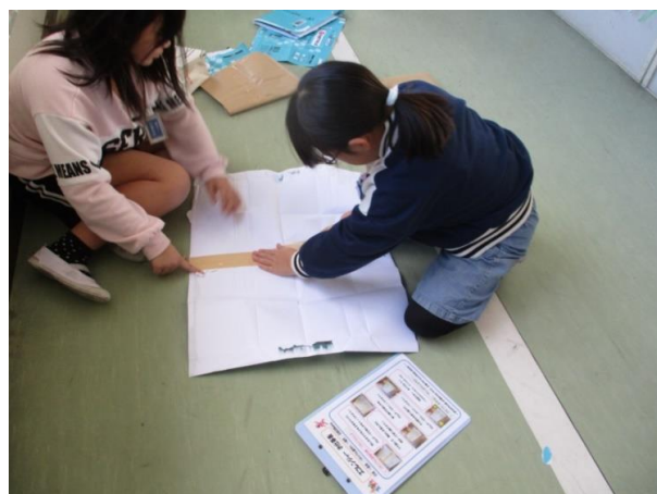
リサイクル袋の作成