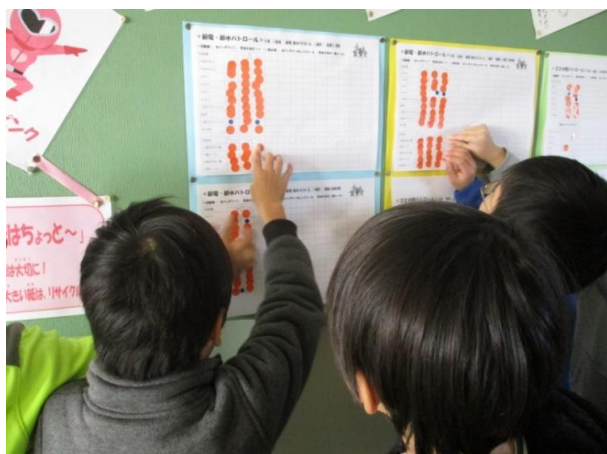
パトロール結果の掲示