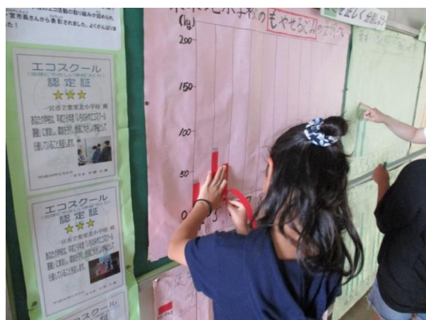
使用量、ごみ量グラフ作成