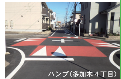
ハンプ(多加木4丁目)