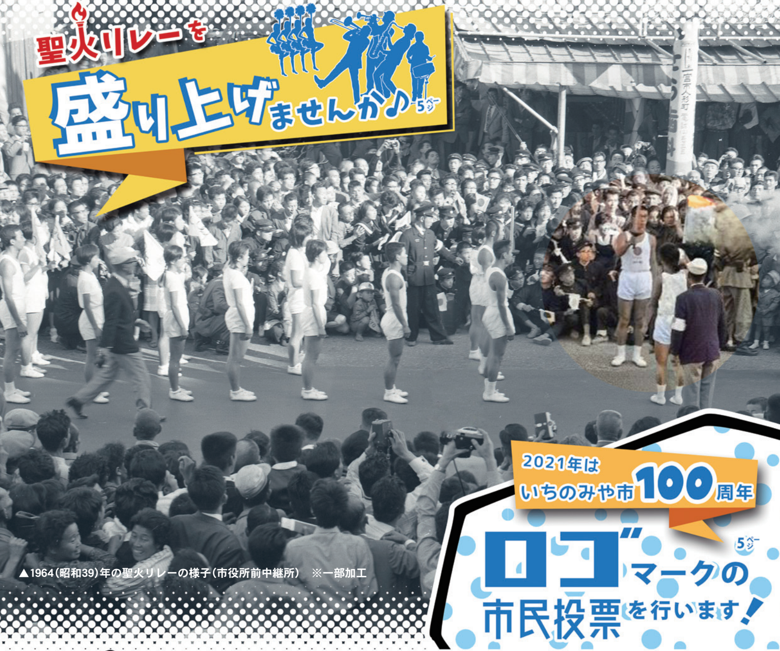
▲1964(昭和39)年の聖火リレーの様子(市役所前中継所) ※一部加工