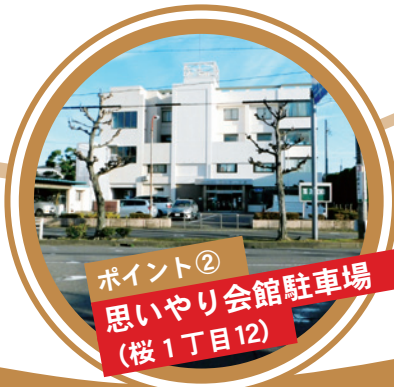
ポイント② 思いやり会館駐車場 (桜1丁目12)