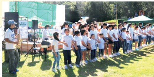
◀「雀のお宿 野外音楽祭」の様子

今後も町会長協議会や関係諸団体との連携を図りながら「安全・安心で思いやりあふれる町づくり」を目指した活動を推進していきます。