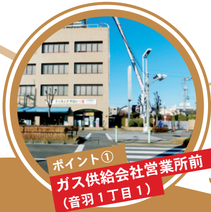
ポイント① ガス供給会社営業所前 (音羽1丁目1)