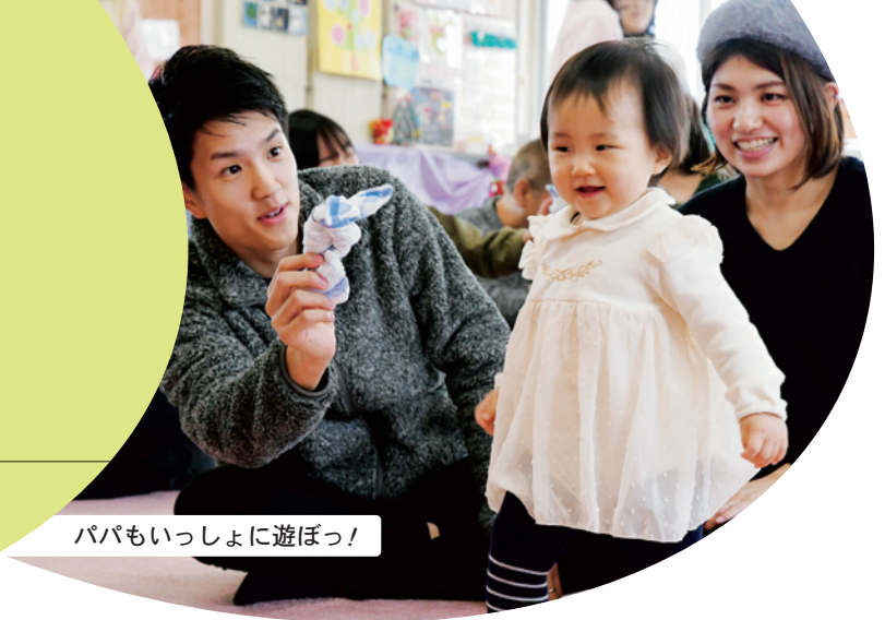
パパもいっしょに遊ぼう!

丹陽 ☎(28)9146 東五城 ☎(85)9339 里小牧 ☎(28)9770