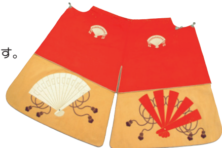
◀ 緋黄羅紗地松扇模様鉾