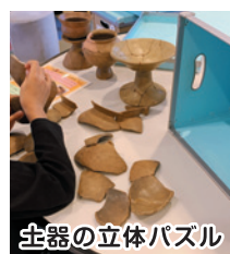
土器の立体パズル

毎年一宮市では全小学校3年生対象に社会科の授業として博物館を見学します。これを機にご家族でも一度足を運んでみてはいかがでしょうか。