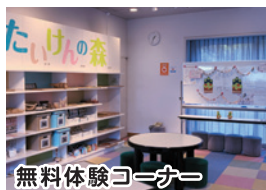
無料体験コーナー

博物館1階受付右上上の曲面壁いっばいに、洋画界の第一人者である絹谷幸二先生が一宮のまちと人々の様子を描いた「あやなすまち一宮 ひとひとひともよう」のアフレスコ画があります。2階には土器パズルなど自由に遊べるスペースがあり、週末には機織り・糸つむぎなど無料で体験できます。