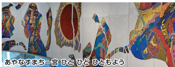
あやなすまち一宮 ひとひとひともよう

博物館1階受付右上上の曲面壁いっばいに、洋画界の第一人者である絹谷幸二先生が一宮のまちと人々の様子を描いた「あやなすまち一宮 ひとひとひともよう」のアフレスコ画があります。2階には土器パズルなど自由に遊べるスペースがあり、週末には機織り・糸つむぎなど無料で体験できます。