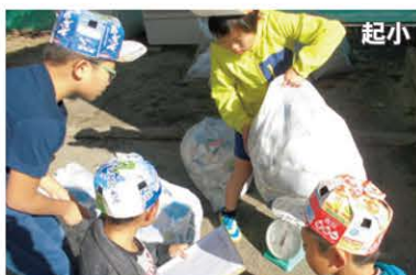
エコキャップをかぶり、 ごみを回収・計量