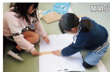
リサイクル用紙回収用の リサイクル袋を作成