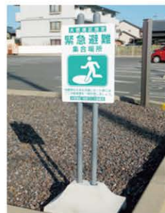
緊急避難集合場所の看板