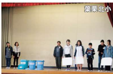
ごみの分別の大切さを、 クイズや劇で発表