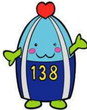
一宮市マスコットキャラクター いちみん

今伊勢町連区は、繊維産業、明治以降は、養蚕業・生糸の産地及び綿花の栽培・綿織物が盛んでした。昭和になって毛織物業で栄え、ガチャマンと呼ばれた豊かな町でした。繊維産業は分業化が進み、住民全体に富をもたらしました。が、時代の波に影響され易く、斜陽化の一途となり、名古屋市と岐阜市に近いことからベッドタウンとして、完全な住宅化が進みました。