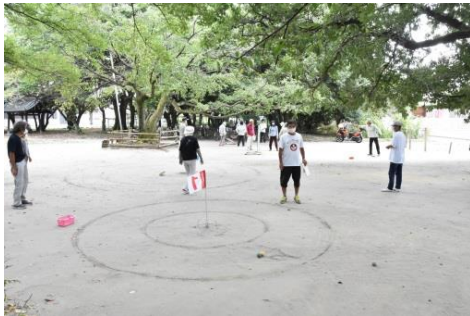
グラウンドゴルフ