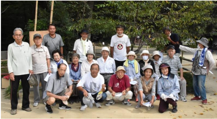
こんな皆さんで楽しんでいます

①宮後長寿スポーツクラブなごみ会 毎週金曜日の午前9時より、野見神社ちびっこ広場にて開催されます。始まりはみんなで合唱して、その後ストレッチ体操をしてから、抽選により4組に別れ、4種類のゲームを2セットずつ行い点数をつけて順位を決めます。表彰式が有りですが成績優秀者が抽選を行います、当選した人に賞品がもらえます。なかなか面白い表彰です。