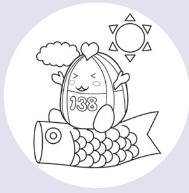
一宮市マスコットキャラクター 「いちみん」