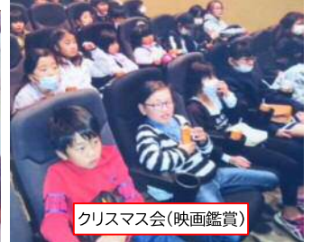
クリスマス会(映画鑑賞)

役員の仕事を通して子どもたちと一年間接して見て、同じ目標を持った時の団結力の強さを教わりました。資金内での活動に苦労しました。