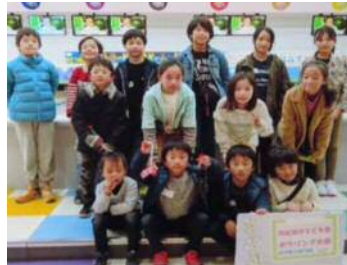
クリスマスボーリング大会