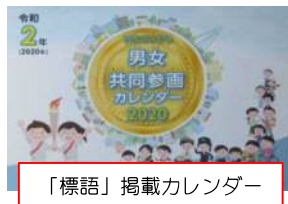
「標語」掲載カレンダー

家庭や職場などさまざまな場面において、男性と女性が互いに人権を尊重しつつ責任を分かち合い、性別や役割にこだわらず、一人ひとりをもつ個性や能力を十分発揮できる社会のことです。