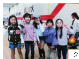
クリスマスボーリング大会

少人数の子ども会ですが、福祉大会、ラジオ体操、クリスマスボーリング大会、お別れ会などの年間行事があります。役員以外の保護者の皆様にも行事に参加していただきありがたく思っております。